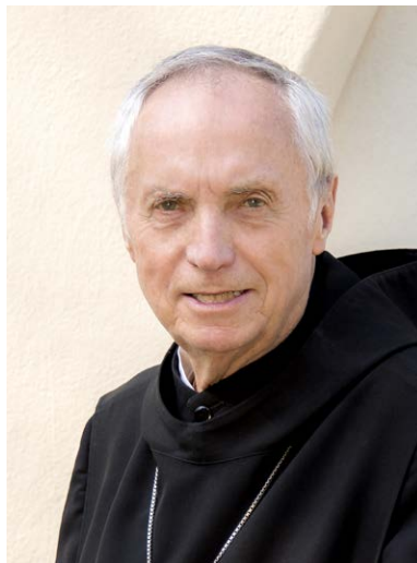
P. Dr. Notker Wolf OSB